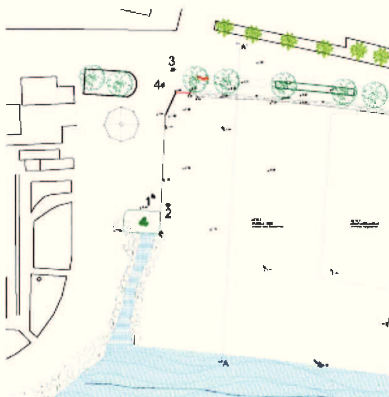
Punti ripresa fotografica