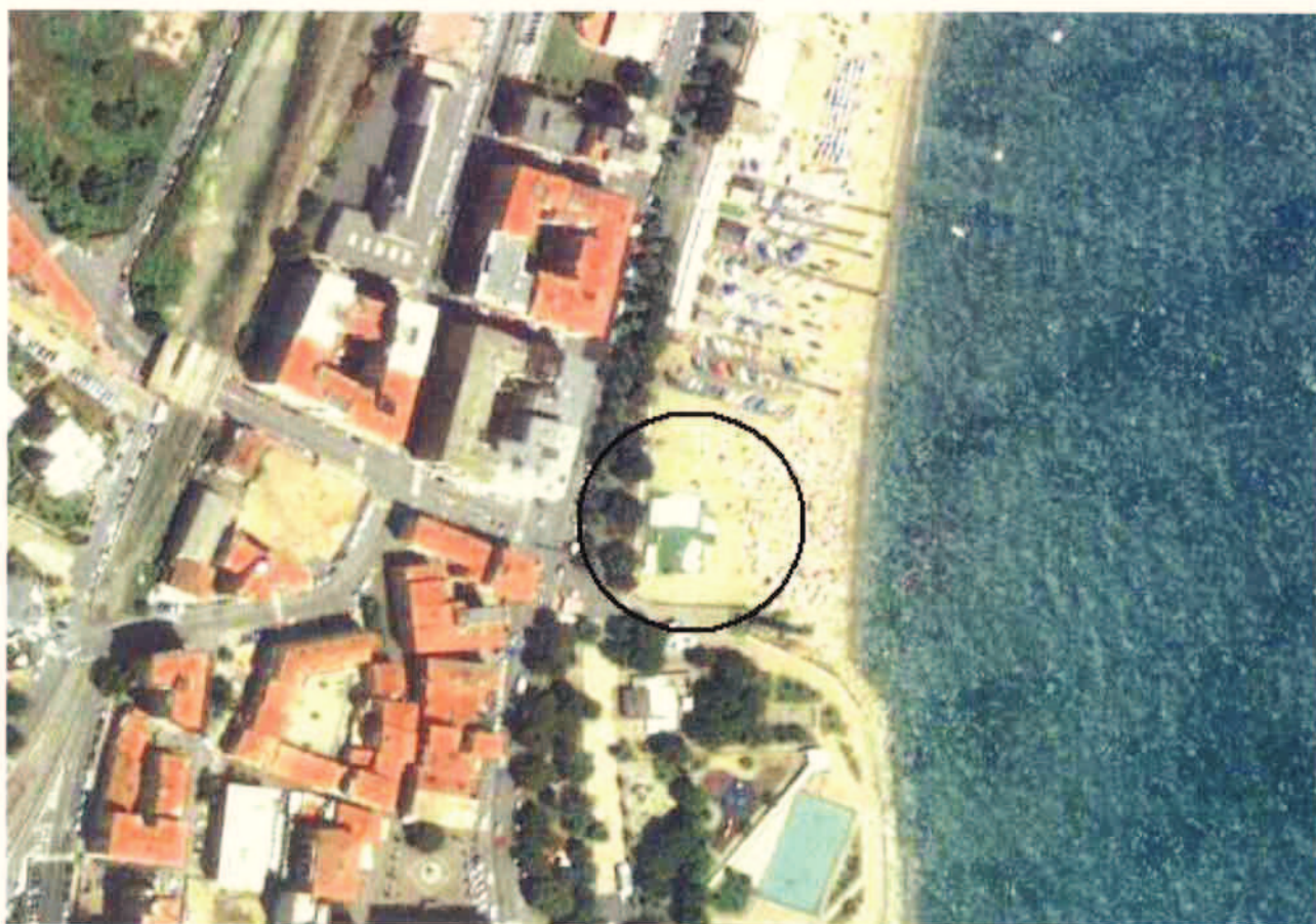
ORTOFOTO con localizzazione dell'area d'intervento